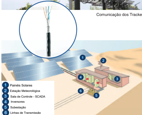
Monitoramento - Sistema SCADA