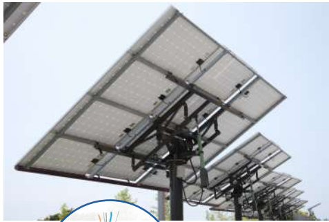
Comunicação dos Trackers

Outras opções que contam com maior resistência mecânica, incluindo armações com trança de aço ou interlock, também estão disponíveis sob consulta.